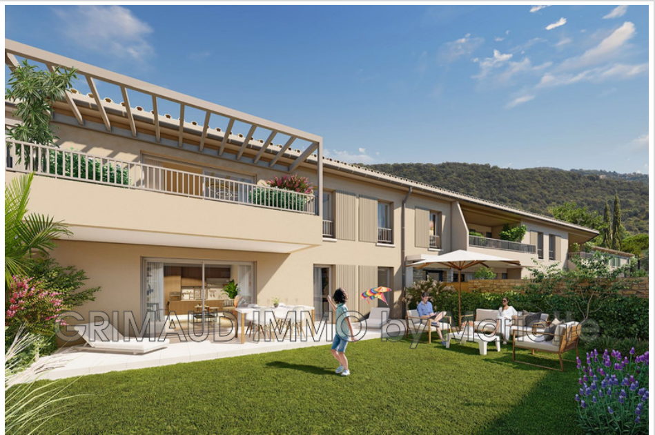
Appartement 954 La Garde-Freinet